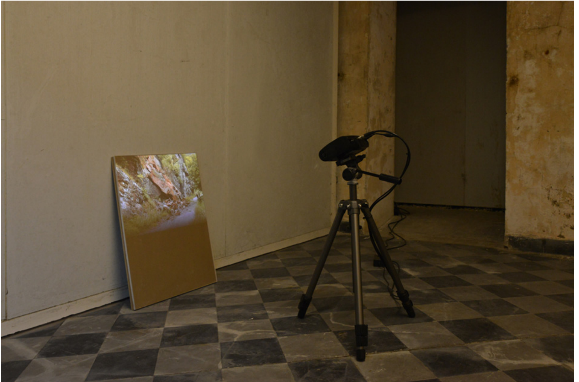
Thomas Bernardet: « L' éboulement », Vidéo couleur, 20 minutes 2012