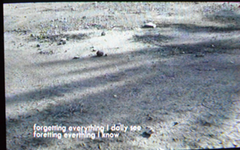
Sylvia Bakker: « Ons toneel van de laatste dagen », Vidéo HD audio, 5 minutes 26 secondes / sous titre en Anglais 2013