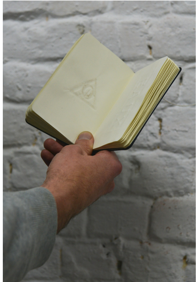
Jerôme Giller : « district 5 », carnets d'empreintes 2011