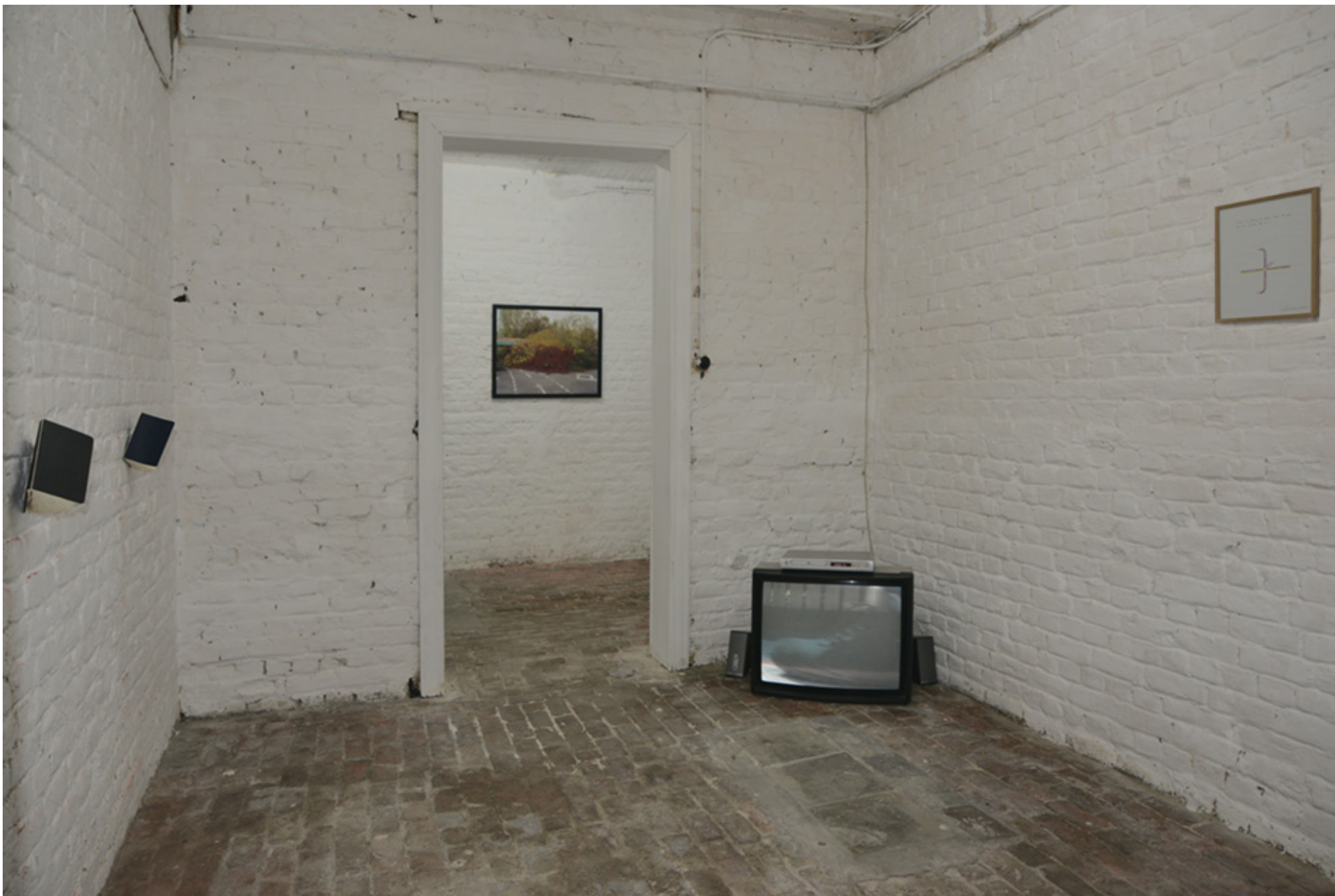
Jerôme Giller : « district 5 », dessins , carnets d'empreintes, vidéo 2011