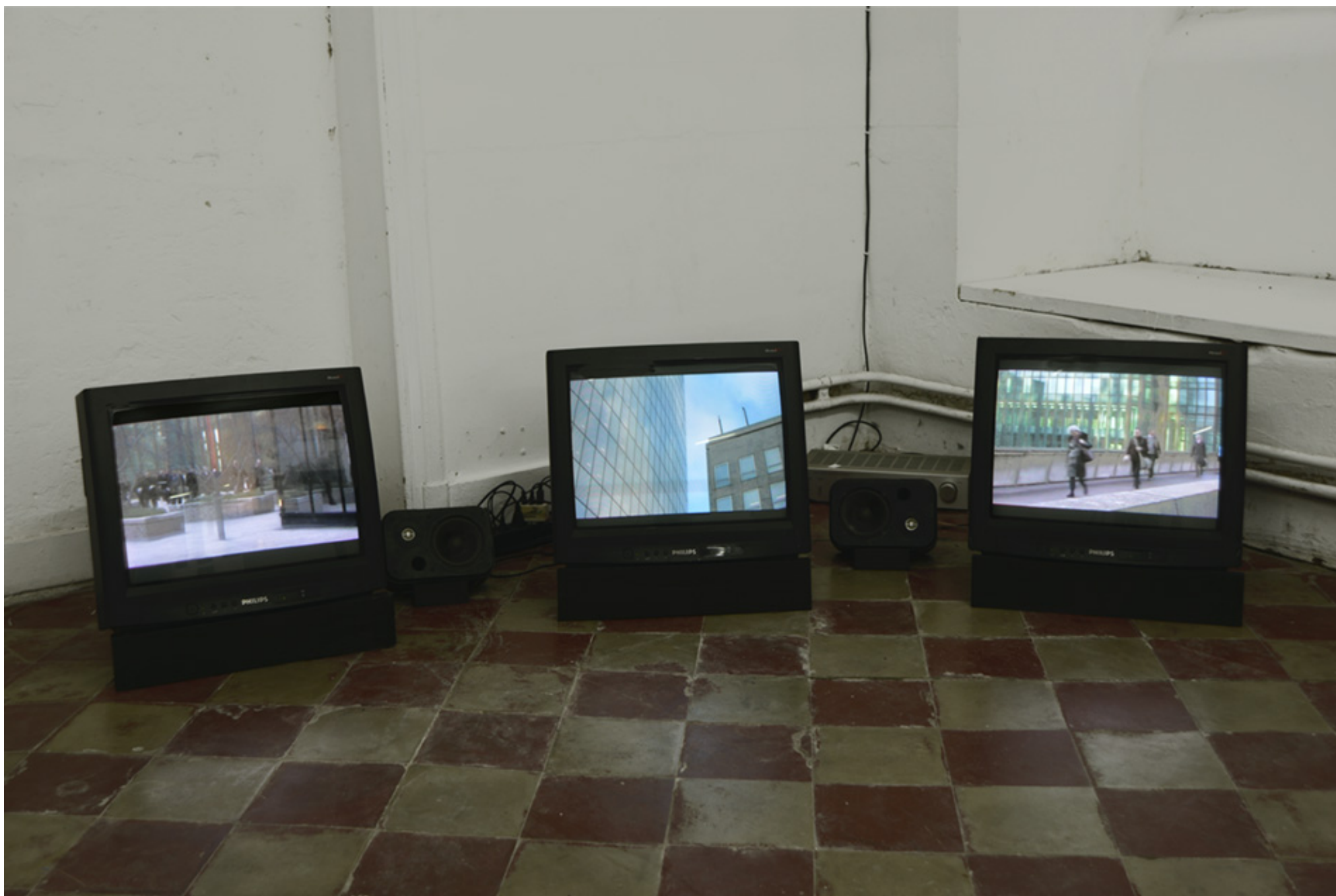
Objets d'échange : « Eclipse », 3 vidéos digitales 2012