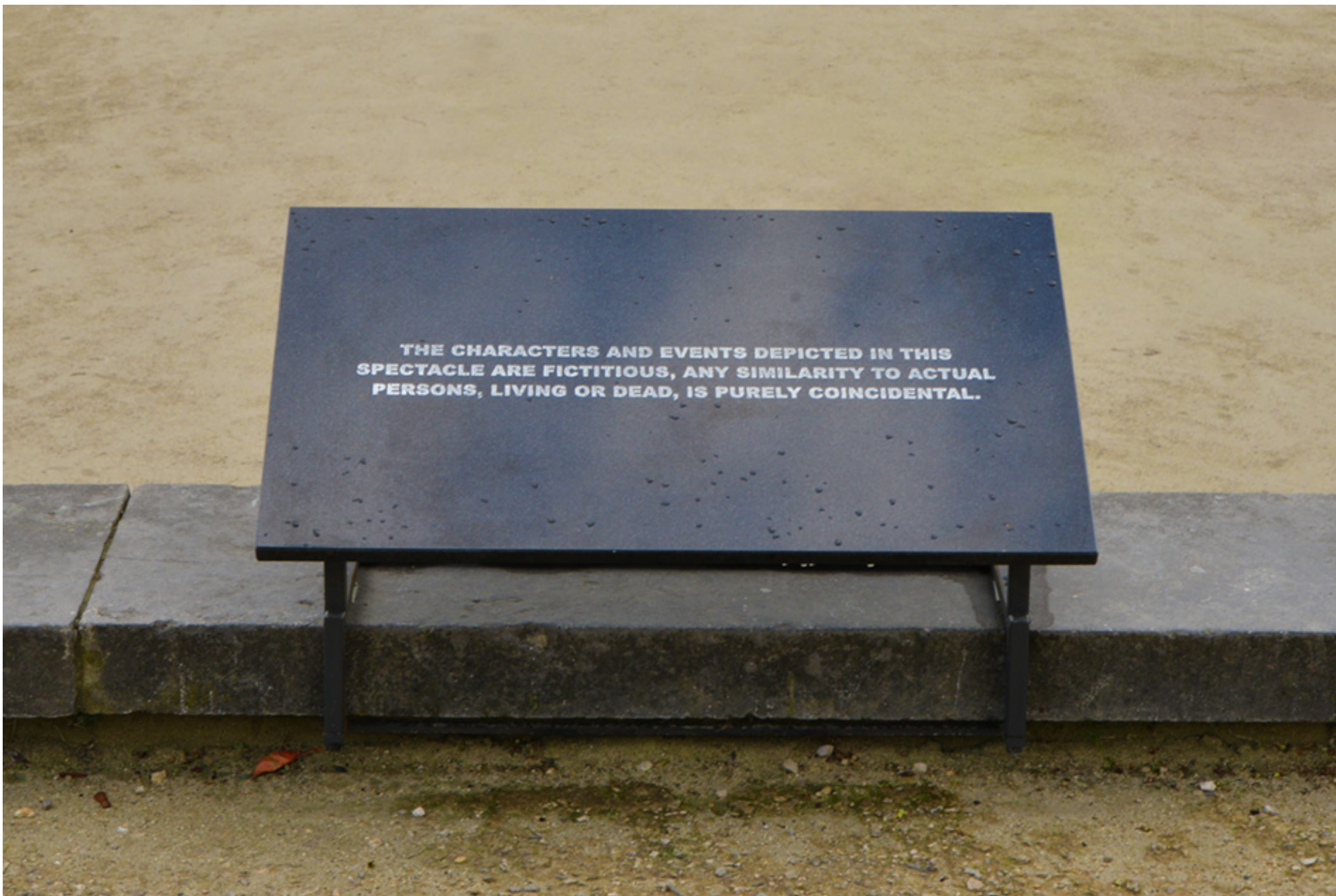
Wouters Huis : « disclaimer » installatie in public space, tekst (film-still) gegraveed in graniet, 2011