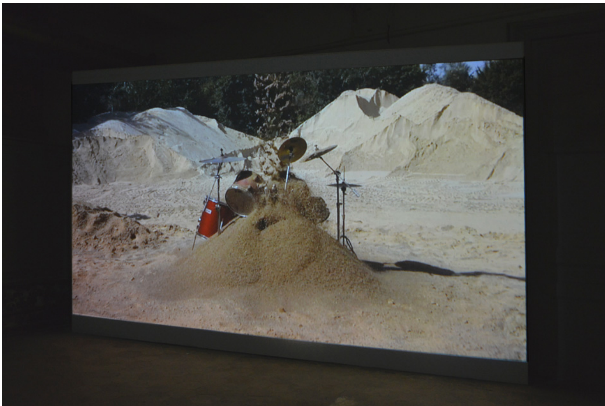
Paul Destieu: « Fade out », vidéo (monobande) HD 16/9 12 minutes 30, son stéréo 2011