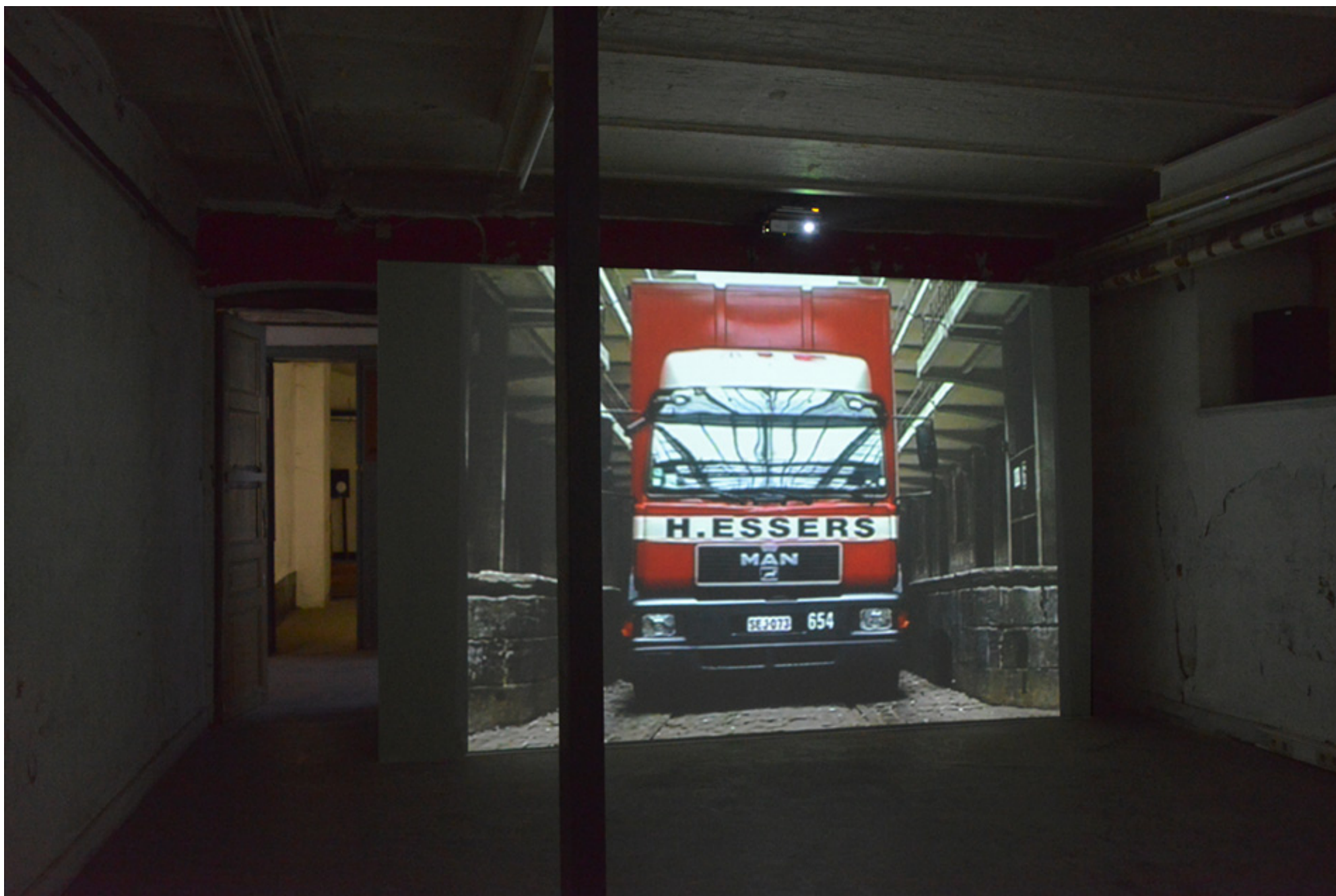
Michel Couturier: « Trucks », installation audio visuelle (2 vidéos face à face) 2001