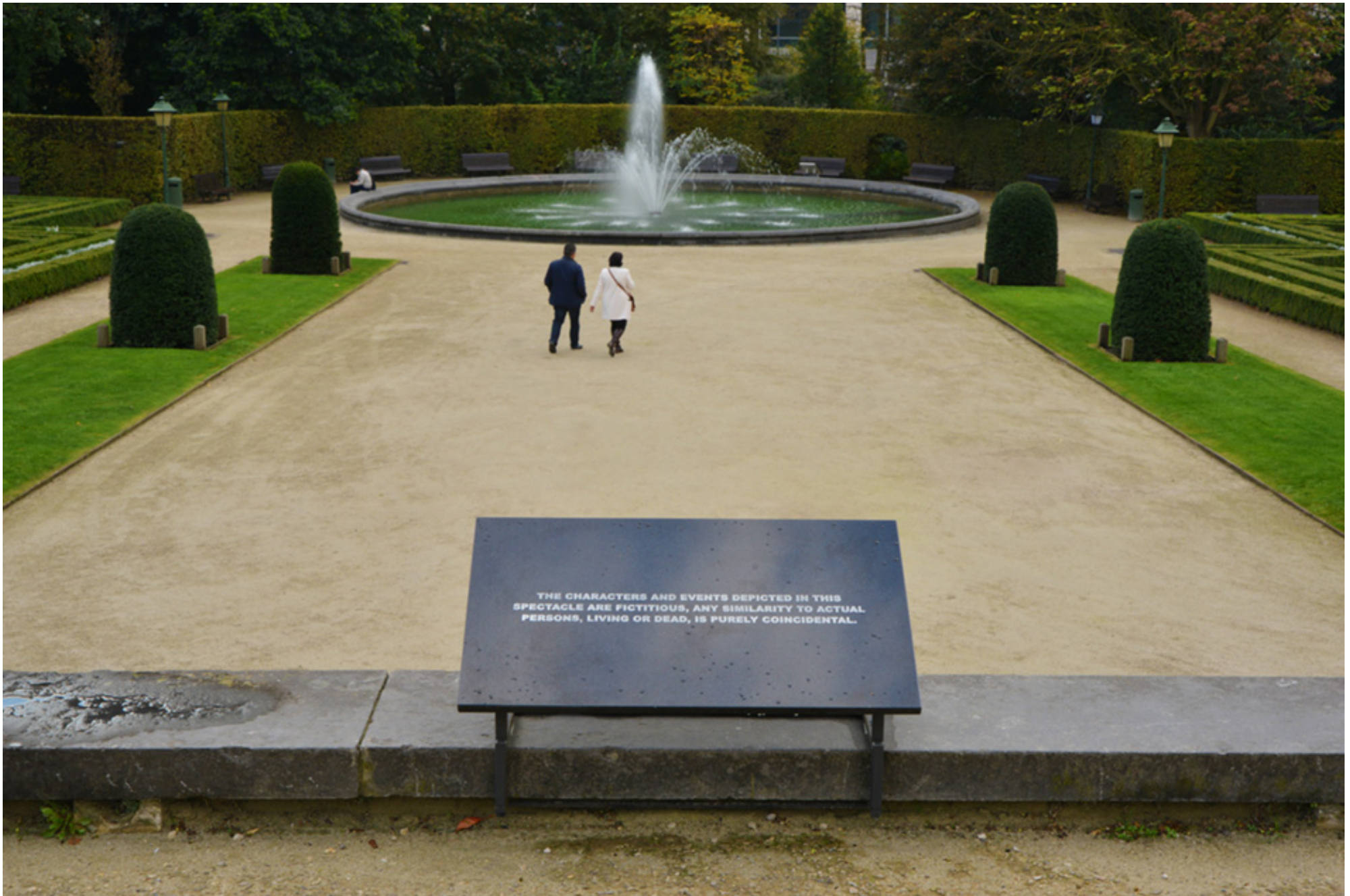
Wouters Huis : « disclaimer » installatie in public space, tekst (film-still) gegraveed in graniet, 2011