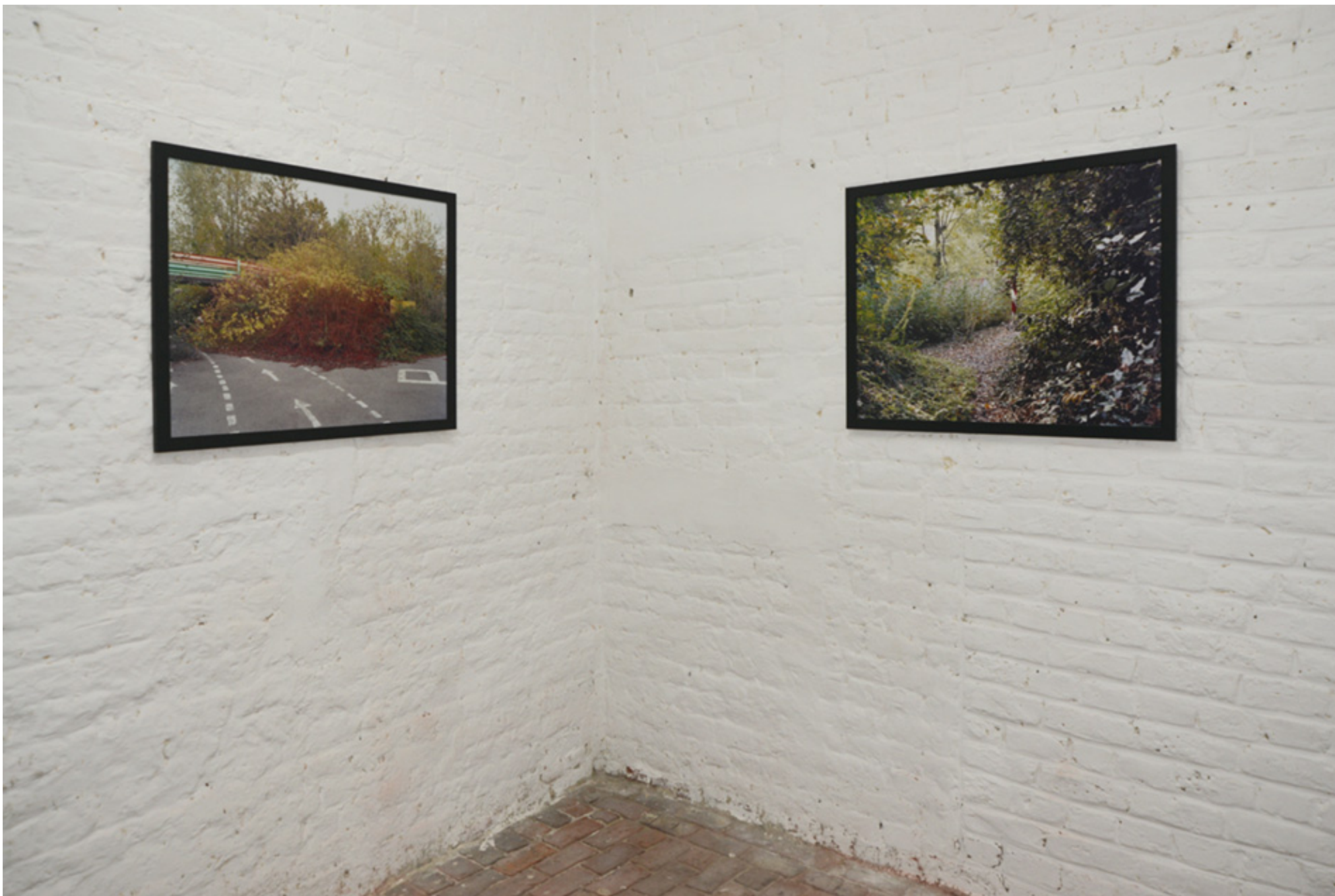
Toma Satoru: « Lost world », photographies 2007