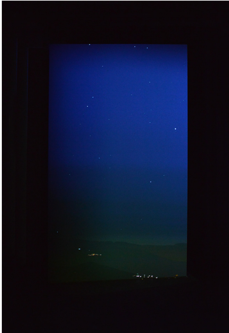
Luce Moreau: Volta , installation vidéo HD, 70 minutes, 2012