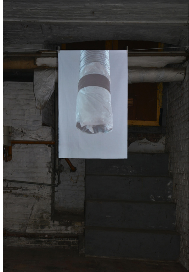
Guy Giraud: « Respirer encore », vidéo HD audio , loop, 2012